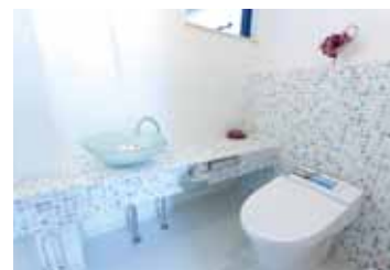
上／給湯設備やインターフォンなどシステムチックなものもハートのモザイクタイルで囲んでかわいく演出。下／一枚一枚表情の異なるモザイクタイルを取り入れたトイレ。その広さには来客もびっくりするそう。