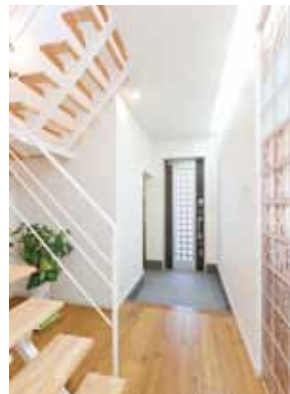
玄関収納も大きくとり、スリット階段がさらに開放感を生み出す玄関。