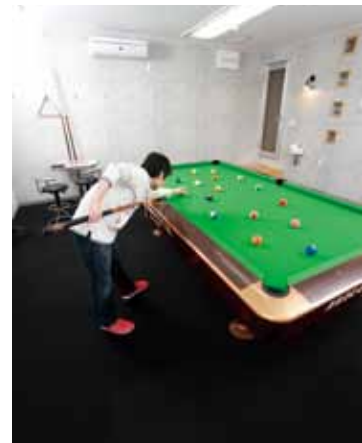
防音設備も整ったビリヤードルーム。仕様も本格的。