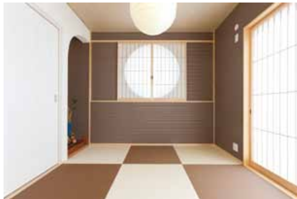
リビングから続く和室は、モダンな和洋折衷の趣きに。丸窓や照明、床の間のアーチなど個性が光る和空間。