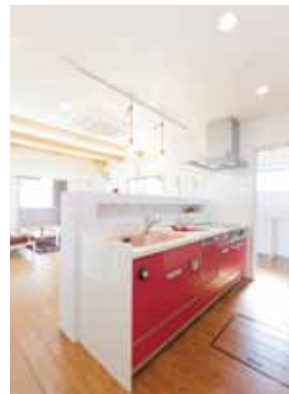
奥さまがこだわったピンクのキッチン。奥のバントリーは勝手口ともつながって。