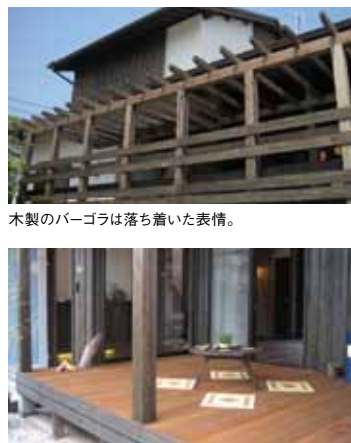
木製のパーゴラは落ち着いた表情。