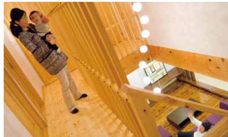
子どもにやさしい自然素材の家づくり。