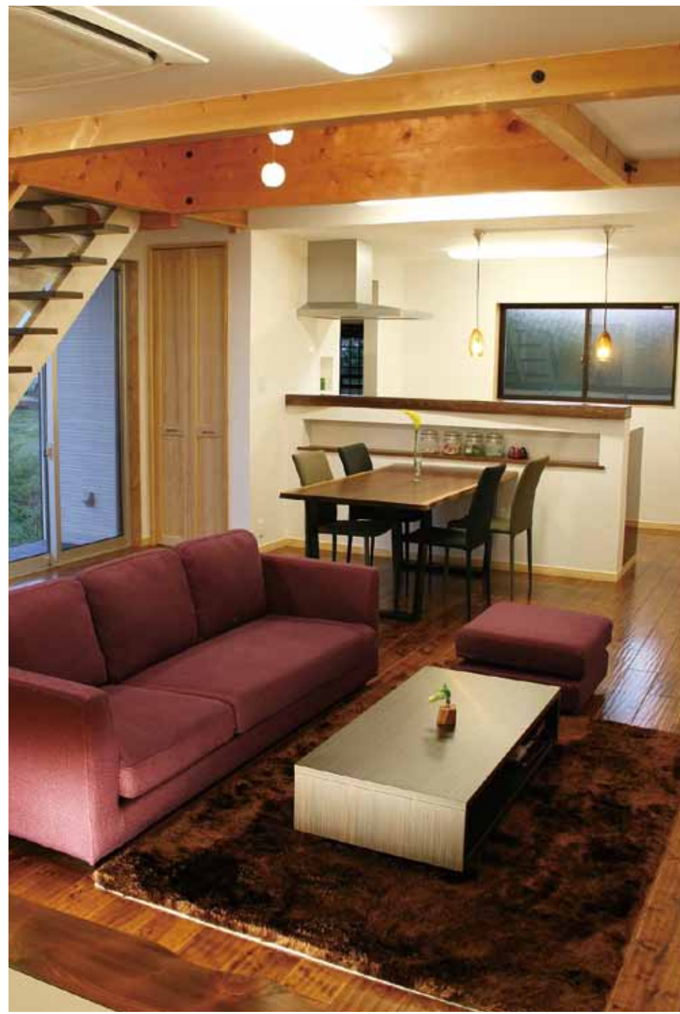
落ち着いた色合いのフローリングに、シックなインテリアがマッチしたリビング。