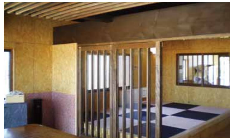
古民家を再生して趣きある和の住まいに。