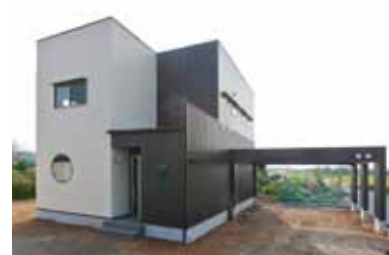
ご夫婦がこだわった丸窓は家のアクセントに。張り出したガレージも一体感のある外観。