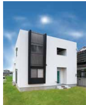
白いBOX型の外観は洗練された印象。