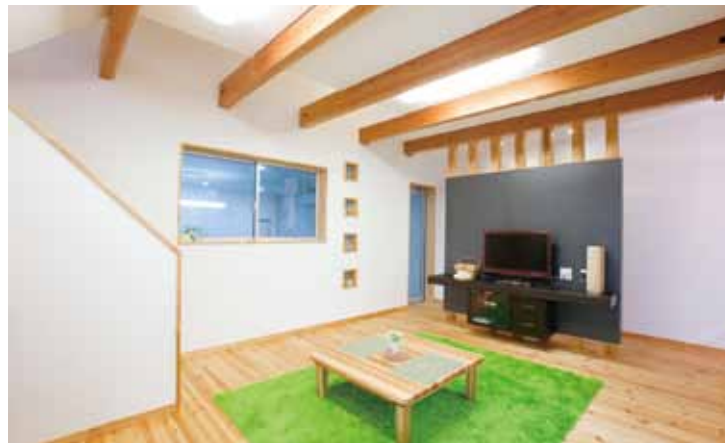
パイン材のナチュラルな風合いが落ち着いたリビング。テレビボードはパーテーションの役割も。