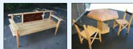
「なんか、イカンジ」、それがOZORA+ZEST style。

インテリアショップと作ったこだわりの家が、続々誕生! 今すぐウェブサイトをチェックして!