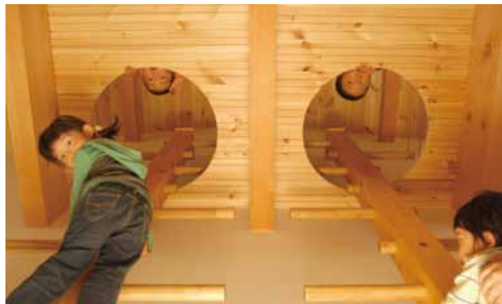
ロフトは子どもたちの格好の遊び場。