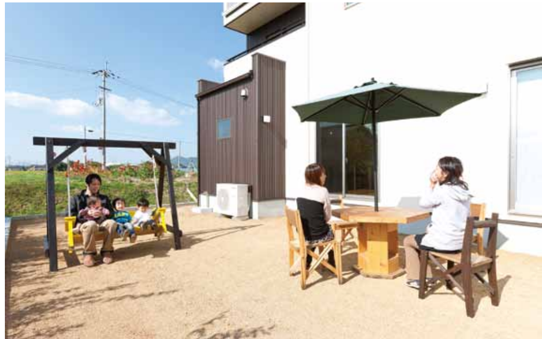
南側には人目の気にならないプライベート空間が広がるO邸。近いうち大きめのデッキも予定しているとか。