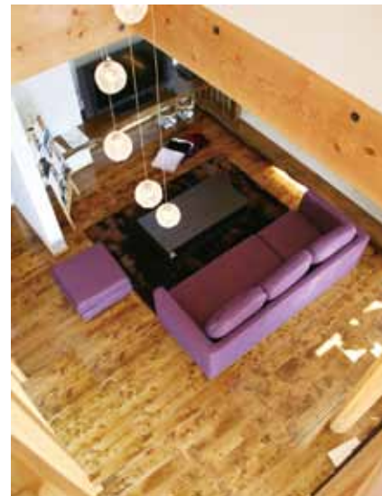
自然素材に囲まれた、家全体が呼吸するような住まい。