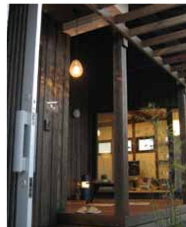
テラス越しにリビングの温かい光がこぼれます。