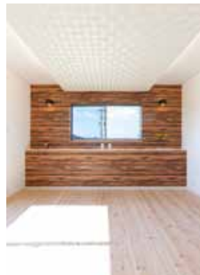
シンメトリーなデザインと間接照明がホテルのような雰囲気のある寝室。